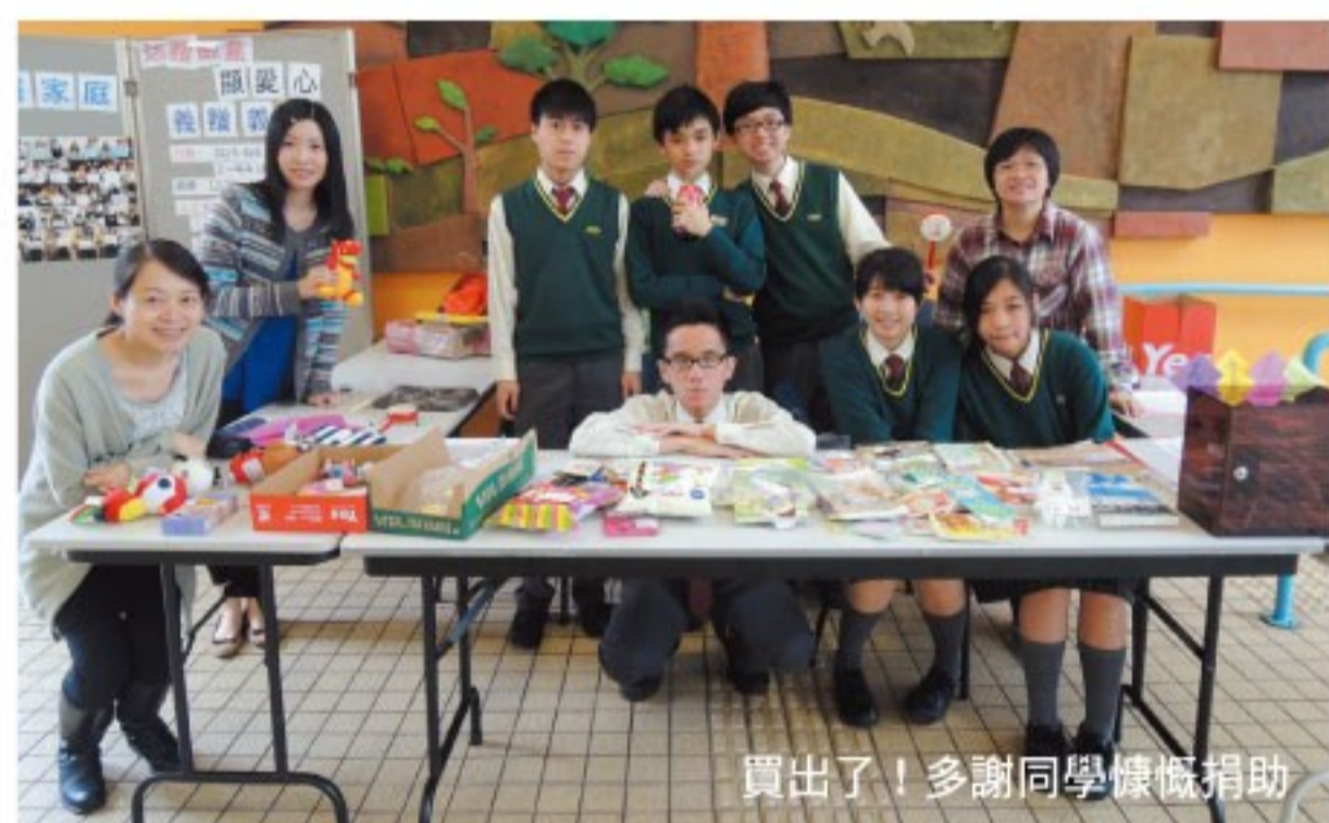
賣出了！多謝同學慷慨捐助

去年3月至4月學校通識教育科和公民教育組舉辦參加社會服務聯會“ACT social awareness network”的「生活艱難-造訪基層家庭」活動。除了透過新聞報道和在通識課堂了解社會劏房問題之外，38位中四和中五同學於3月5日跟隨老師訪問了深水埗劏房戶，親身了解社會貧窮問題。