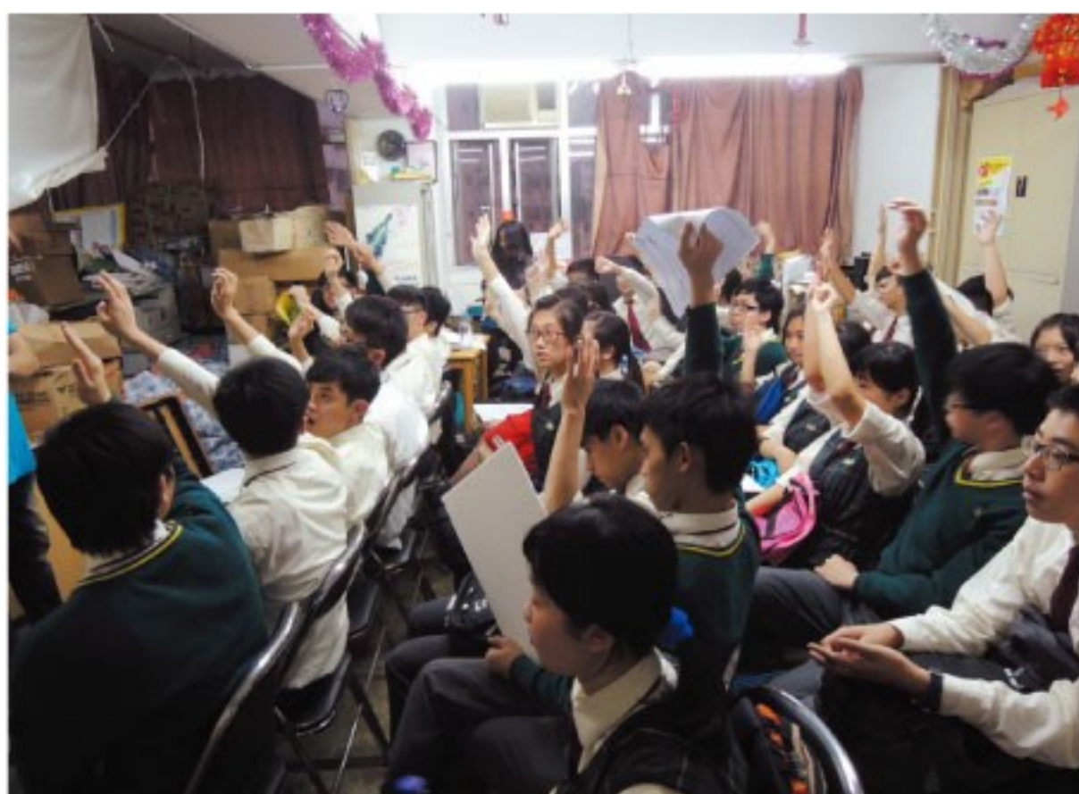
▲探訪劏房前同學踴躍參與探究活動

另一組同學探訪的是一間連100呎也不到的劏房。該處有14伙劏房戶連在一起的，入口卻只得13個。還有一個入口呢？答案是第14戶的入口是在假天花上，租客只可攀梯爬入。該劏房內只得臥睡的地方，租金卻受惠$1350，正好是綜援租金津貼的上限。此情此境，你想到了甚麼？