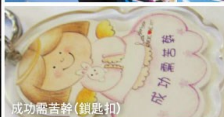
成功需苦幹(鎖匙扣)