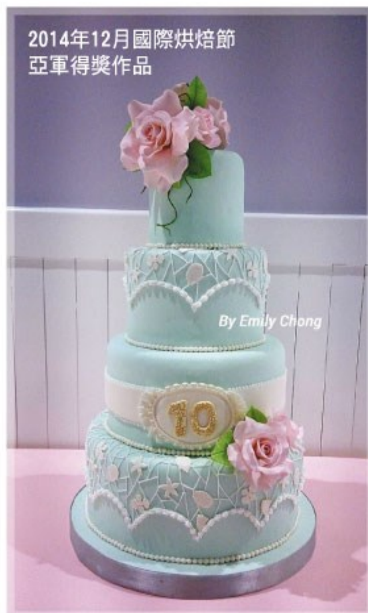
2014年12月國際烘焙節 亞軍得獎作品

希望我這個真實例子可以鼓勵同學，無論成績好或不好，都絕對有機會升讀大學，甚至往後可以在其他專業範疇繼續進修，所以真的不要放棄啊！