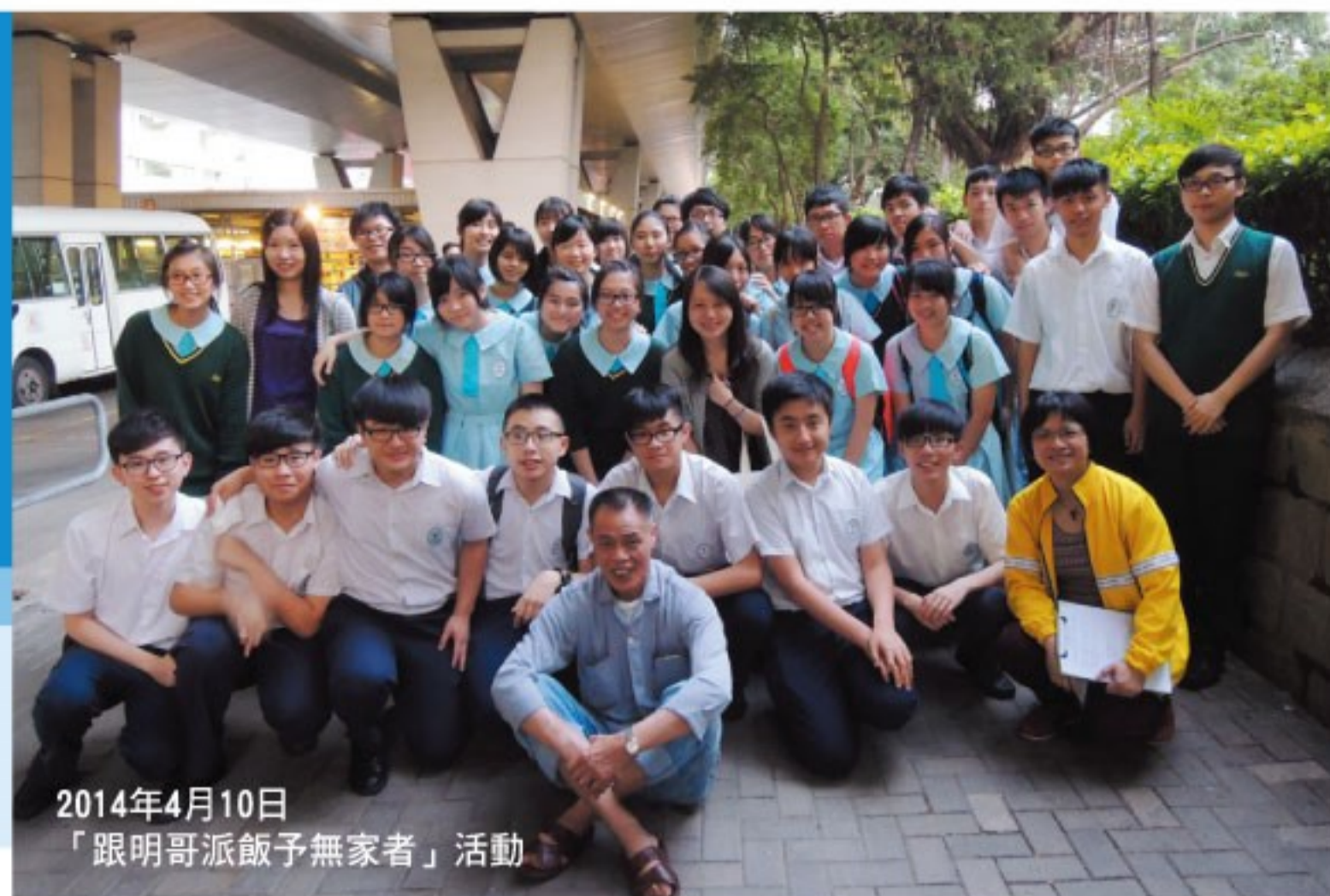
2014年4月10日 「跟明哥派飯予無家者」活動